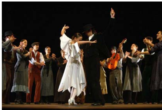
Bodas de sangre – Cie Antonio Gadés

Entre ça et ça, la sublime revanche Marie Dubas de haut en bas Le Quatuor